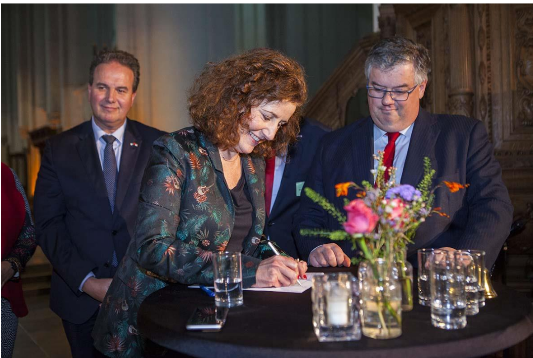
Op 10 november 2018 is een samenwerkingsovereenkomst ondertekend namens overheden, kerkeigenaren en vertegenwoordigers van erfgoed- en burgerorganisaties

Het doel van deze overeenkomst is een duurzaam toekomstperspectief te ontwikkelen voor het religieus erfgoed. Om dat te bereiken moet ál het religieuze erfgoed in samenhang gezien worden. Religieus erfgoed van alle tijden, van alle geloven, monumentaal en niet-monumentaal. In deze nieuwsbrief leest u hoe dat in uw provincie vorm krijgt.